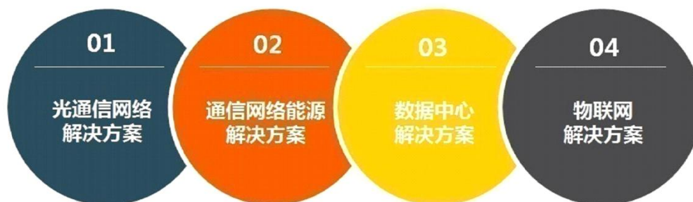
图：公司四大产品解决方案

通信网络能源是一个复杂的一体化的系统，需要对通信行业场景应用有深入的理解并利用的积累行业数据进行场景设计和场景融合定义，以保证系统的稳定性。公司通过在电源、电池、散热、机柜、物联网等细分领域的持续研发投入，构筑产品竞争优势，形成了四大产品解决方案：光通信网络解决方案、通信网络能源解决方案、数据中心解决方案和物联网解决方案。其中， 光通信网络解决方案 为客户提供传输网、接入网和无线网的光纤物理连接产品、模块和器件，实现全光通信网络的高效覆盖。 通信网络能源解决方案 为客户建设通信机房、基站提供电源分配、转换、管理设备及末端站址的物理空间承载设施，为客户构建安全、高效、绿色的通信网络。 数据中心解决方案 为客户提供从核心数据节点到边缘数据节点的多场景条件下的数据中心能源建设产品，帮助客户构建高效、低耗的数据云。 物联网解决方案 为客户提供通信局、站、井等固定资产设施的物联网化产品和管理系统，提升设施管理的智能化，公司利用在物联网解决方案的技术积累，在通信网络能源解决方案和数据中心解决方案上叠加远程管理和大数据服务，形成智慧能源解决方案，提升客户的经营管理价值。